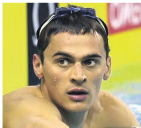
Александр Владимирович Попов

Выдающийся советский и российский пловец, четырехкратный олимпийский чемпион, шестикратный чемпион мира, 21-кратный чемпион Европы. Награжден орденом «За заслуги перед Отечеством» III степени, орденом Дружбы. Заслуженный мастер спорта СССР.